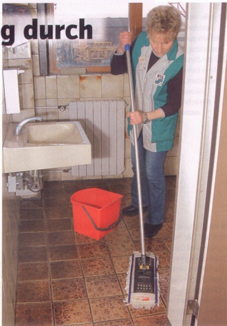
BILDER: RATIONELL REINIGEN